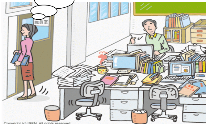
Copyright (c) ISEN. All rights reserved.

・総行動（市に対して、市民・市内で働く仲間と行う要求運動）のアンケートです。 10月8日(金曜日) までに支部に届けてください。